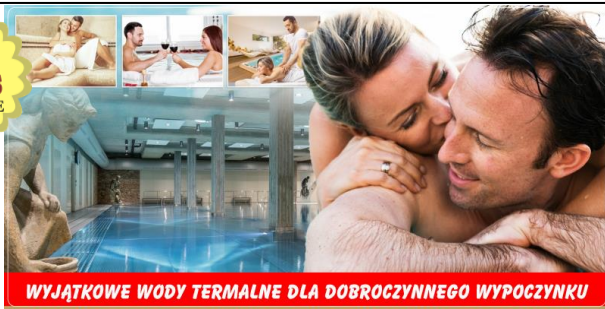
WYJĄTKOWE WODY TERMALNE DLA DOBROCZYNNEGO WYPOCZYNKU

Kurort TEPLICE należy do najstarszych w Europie, za sprawą otoczenia ogrodami i urokliwej secesyjnej zabudowie nazywany jest „Małym Wersalem”. Sławę zawdzięcza korzystanym dla zdrowia właściwościom (działaniem) miejscowych wód termalnych i mikroklimatu. Podczas wypoczynku skorzystamy także z zabiegów i masażu!